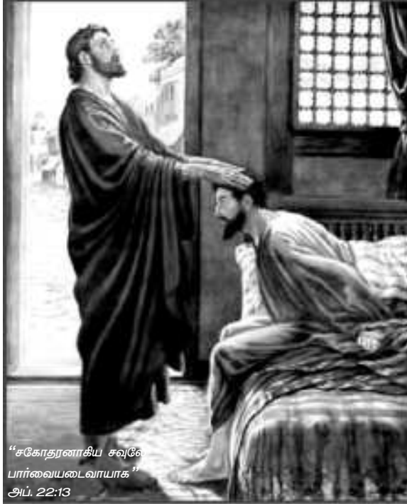
“சகோதரனாகிய சவுலே பார்வையடைவாயாக” அப். 22:13

போல் வாழ அவருக்கு ஊக்கமளித்திருக்க முடியாது. அவருடைய விசுவாசக் கண்கள் காணப்படாதவைகளின் மேல் இருந்தது. அவர் மேலான நன்மையும், ஆசீர்வாதத்தையும் உடைய மனிதராக மட்டுமல்லாமல், ஏறக்குறைய இதற்கு முன் சம்பவித்திராத துன்பத்தினையும் உடைய அசாதாரணமான நபராவார். “பின்பு அகாலப் பிறவி போன்ற எனக்குத் தரிசனமானார்” (1 கொரி. 15 : 8) என்ற வார்த்தையின் மூலம் அவர் ஆண்டவரை அவருடைய மகிமையில் கண்டிருக்கிறார்; மேலும் “சவுலே, சவுலே நீ என்னை ஏன் துன்பப்படுத்துகிறாய்? முள்ளில் உதைக்கிறது உனக்குக் கடினமாம்” என்று அவருடனே பேசின இயேசு கிறிஸ்துவினுடைய கிருபையான சத்தத்தையும் கேட்டிருக்கிறார். அன்னியா என்பவன் பவுலை நோக்கி “நம்முடைய முன்னோர்களின் தேவனுடைய திருவுளத்தை அறியவும், நீதிபரரைத் தரிசிக்கவும், அவருடைய திருவாய்மொழியைக் கேட்கவும், அவர் உன்னை முன்னமே தெரிந்து கொண்டார். நீ கண்டவைகளையும் கேட்டவைகளையும் குறித்துச் சகல மனுஷருக்கு முன்பாக அவருக்கு சாட்சியாயிருப்பாய்” என்று கூறினான். (அப். 22 : 12-16). அவர் தரிசனத்தில் “மூன்றாம் வானம் வரை கிறிஸ்துவின் ஆயிர வருட ஆட்சிக் காலம்வரை எடுக்கப்பட்டார்”. மேலும் ஒரு கூடி நேரத் தரிசனத்தில் அந்த நீதியின் ஆளுகையின் மகிமையையும், பேரின்பத்தையும் காண அனுமதிக்கப்பட்டார். திரும்பத் திரும்ப விஷேசமான, தனிப்பட்ட உற்சாகத்தை